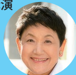
エグゼクティブ・サポーター 坂東真理子氏 昭和女子大学学長