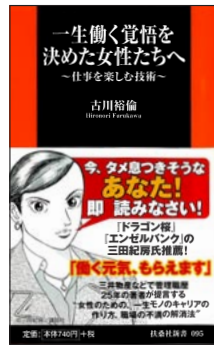
一生働く覚悟を決めた 女性たちへ ～仕事を楽しむ技術～ (扶桑社新書)