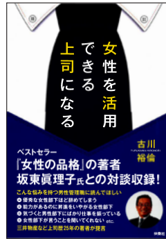
女性を活用できる 上司になる (扶桑社)